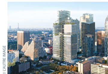
Odyssey La mixité exacerbée Paris-La-Défense, en cours d'études