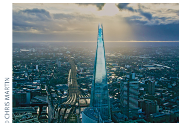
The Shard Une tour exemplaire Londres, 2012