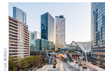
Trinity Retour vers le futur Paris-La-Défense, 2020